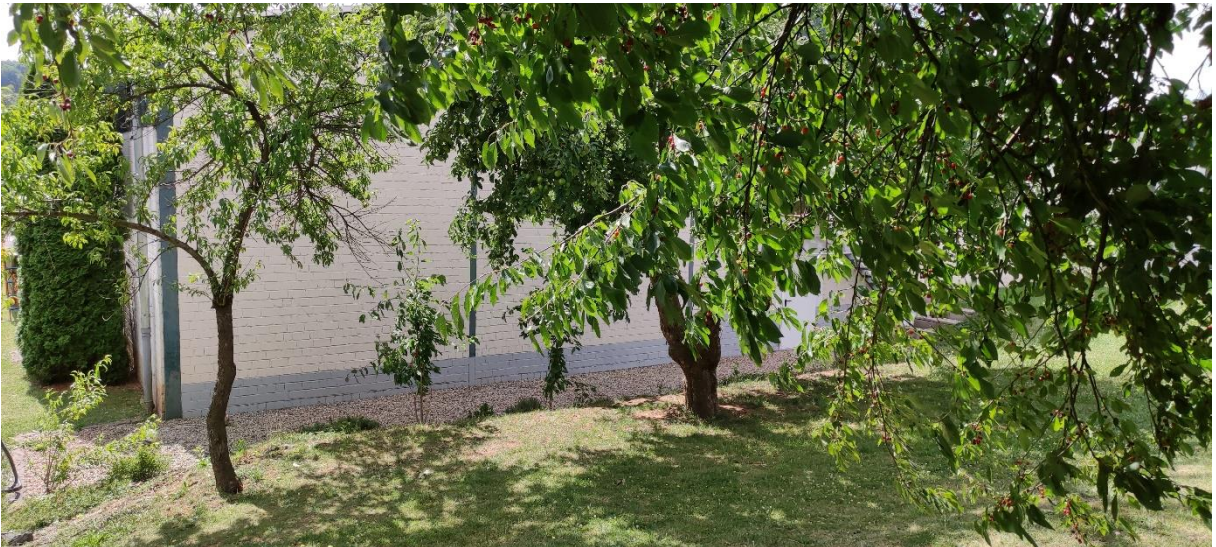
Abbildung 3) Einblick in die Baumgruppe