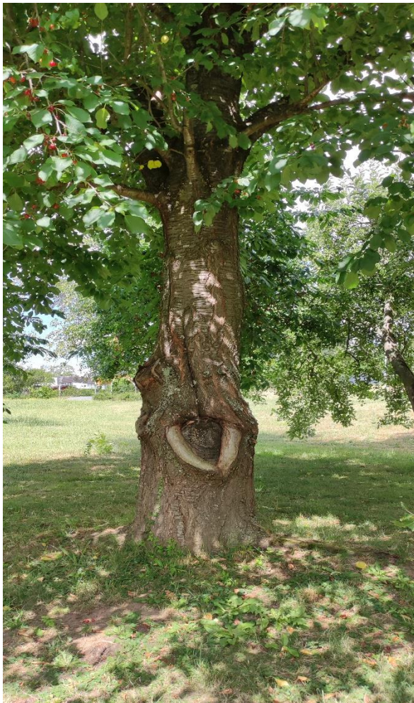
Abbildung 2) Alter Kirschbaum auf der Rasenfläche