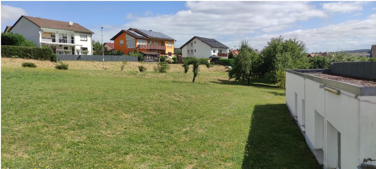
Abbildung 4) Gärtnerisch gepflegte Anlage im Eingriffsbereich