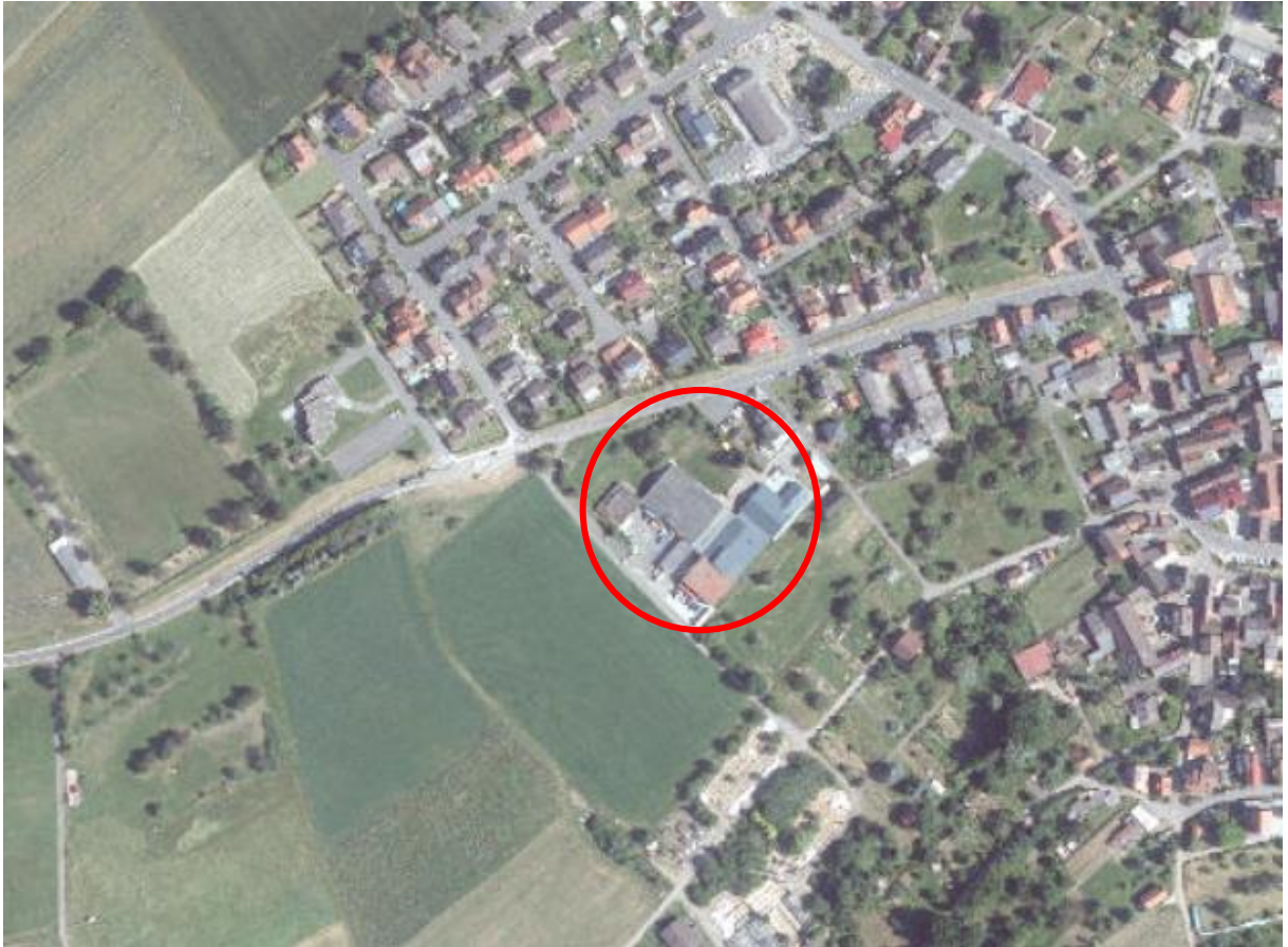
Abbildung 1) Lage des Vorhabens (rot), Quelle: www.geoportal.hessen.de