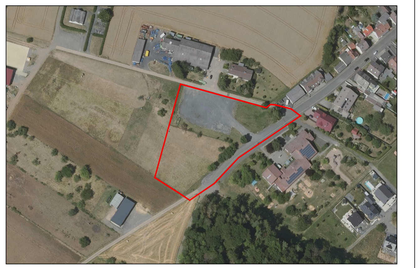
Übersichtsplan (ohne Maßstab) © Hessische Verwaltung für Bodenmanagement und Geoinformation