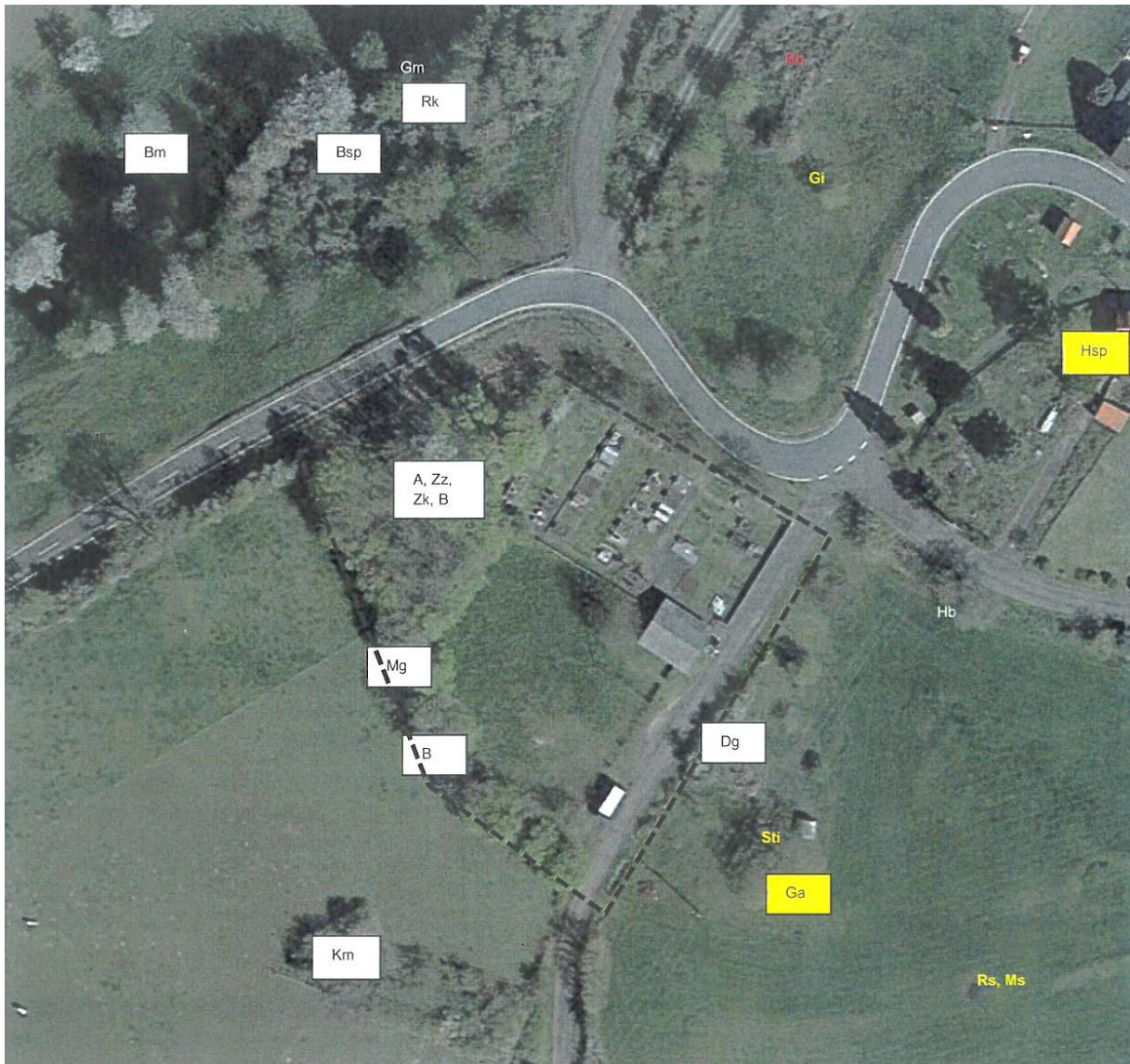
Abbildung 1: Nachweis Vögel (weißer Kasten: Brutvogel (BV) in günstigem Erhaltungszustand (EHZ), gelber Kasten: BV in unzureichendem EHZ; weiß: Nahrungsgast (NG) in günstigem EHZ, gelb: NG in unzureichendem EHZ, rot: NG in schlechtem EHZ)

Es konnten keine für das VSG „Vogelsberg“ relevanten Vogelarten im Untersuchungsbereich nachgewiesen werden.